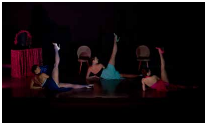
MARYLIN PRETTY THINGS Amuovo DC - Capbreton Danse contemporaine

Qui sera la grande gagnante du concours «Je suis Marilyn !» ?